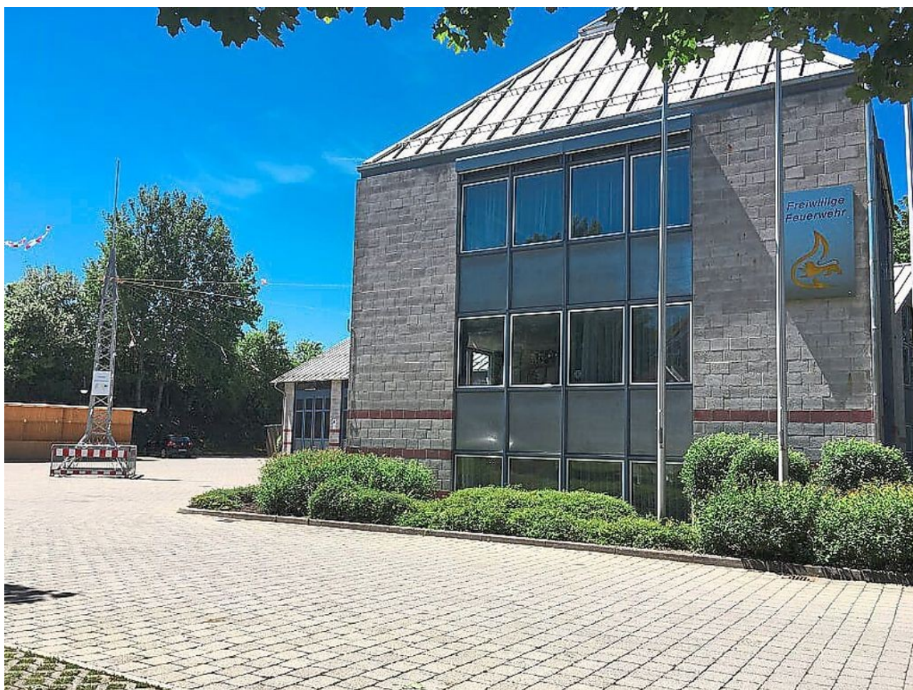
Rund um das moderne Feuerwehrhaus wird das Jubiläum gefeiert.

Nach der Übergabe und Weihe des neuen Gerätewagens GW-L2 im Mai, der Teilnahme an der Südwestmesse, folgt jetzt die Dreitagesfeier zum besonderen Jubiläum. Eichkorn und die Seinen sind in diesem Jahr gut beschäftigt, ganz abgesehen von ihren Einsätzen im Falle des Falles. Im vergangenen Jahr ertönte für die Brigachtaler der Alarm übrigens 33 Mal, 13 Brandeinsätze wurden verzeichnet.